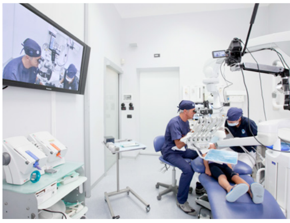
Centro corsi incentrato sulla comunicazione con schermi dedicati

Il corsista usufruisce di una struttura per la parte pratica munita di manichini Kavo con elevato livello di simulazione in quanto il manichino è direttamente montato sulla poltrona del riunito. Ha a disposizione microscopi operativi con telecamere inserite in grado di registrare i singoli passaggi operativi e il lavoro svolto nella sequenza che potrà essere commentato dal docente